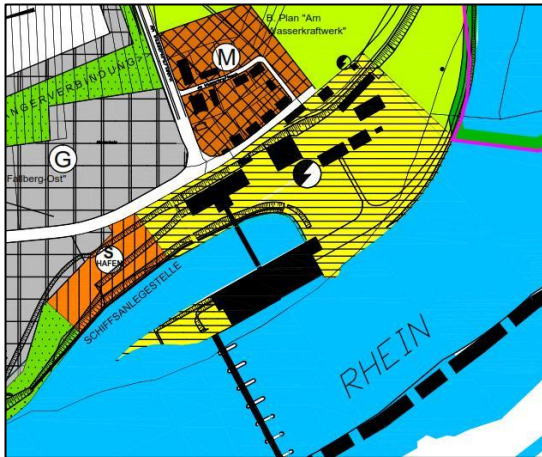
Abbildung: Ausschnitt aus dem gültigen FNP